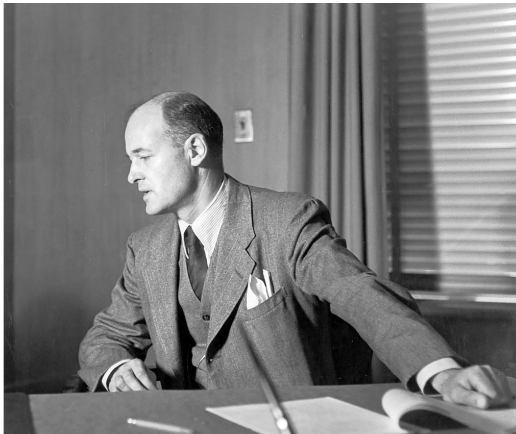
Джордж Кеннан George Kennan

націй до неї та від ступеня енергійності, рішучості й згуртованості, з якою ці країни захищатимуть в ООН мирну й обнадійливу концепцію міжнародного життя, що її ця організація представляє відповідно до їхнього способу мислення. Москва не має абстрактної відданості ідеалам ООН. Її ставлення до цієї організації надалі буде, по суті, прагматичним і тактичним». Кеннанівська оцінка ставлення Москви до ООН ще й тому цікава, бо його подекуди вважають русофілом.