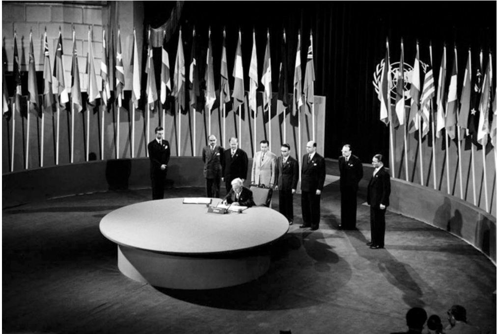
Підписання Статуту ООН під час конференції в Сан-Франциско, 1945 р.