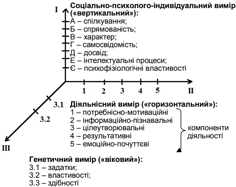
Рис. Тривимірний психологічний структурний особистості в узагальненій формі (за В. В. Рибалкою)

Здійснюючи аналіз і синтез системної психологічної структури особистості, стверджує автор, слід урахувувати, на якому рівні узагальнення вибудовують цю структуру.