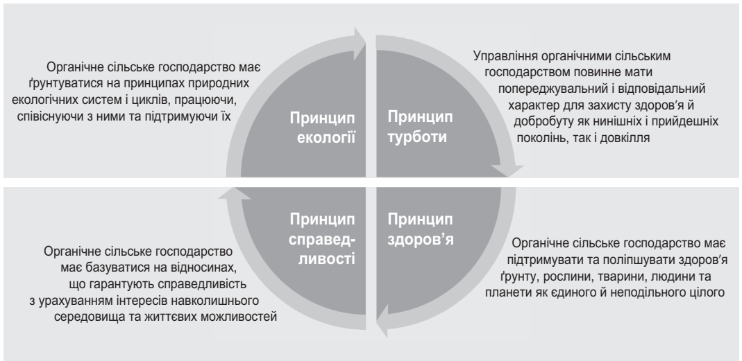
Рис. 1. Базові принципи органічного сільського господарства згідно з IFOAM – Organic International.