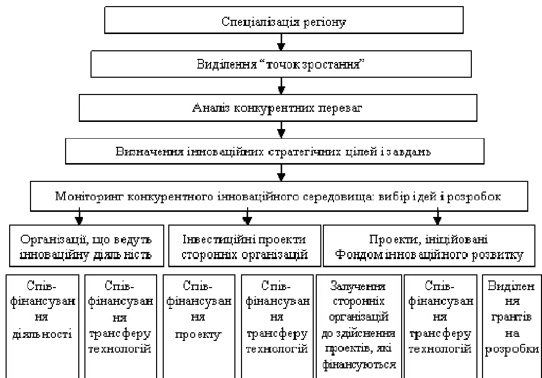
Рис. 2. Поетапна схема відбору альтернатив інноваційного розвитку

У результаті запропонованих нами заходів уже наявні структури інноваційної мережі регіону: УкрІНТЕІ, УкрНТІ "Промтехнологія", Торгово-промислова палата тощо – здійснюватимуть інформаційну, освітню, рекламну функції і подаватимуть найбільш перспективні інноваційні ідеї та проекти Експертній науково-технічній раді, що складається з представників суспільства, бізнесу й науки. Експертна рада оцінює ринковий потенціал розробок, відповідність обраної інноваційної стратегії розвитку регіону і подає відібрані альтернативи Фондові інноваційного розвитку регіону. Функції останнього – прийняття рішень про варіанти фінансової підтримки даних перспективних інноваційних розробок [4].