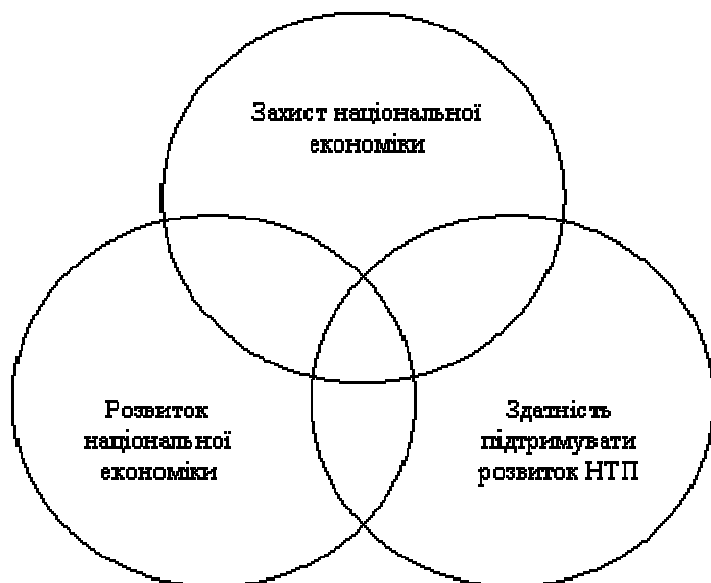
Рис. 2. Складові розвитку економічної безпеки

Потрібно врахувати вплив на національну економіку інтеграційних об'єднань, що дозволить з'ясувати економічний потенціал такого об'єднання та ефективні шляхи зменшення негативних ефектів від інтеграції. На нашу думку, для скасування впливу негативних процесів інтеграції на економічне зростання важливо використати такі фактори державного регулювання, як вплив на пропорції інвестицій у різні галузі національної економіки, на розвиток інфраструктури, на освіту й науку. Причому цей перелік може постійно змінюватися з урахуванням вітчизняних економічних інтересів.