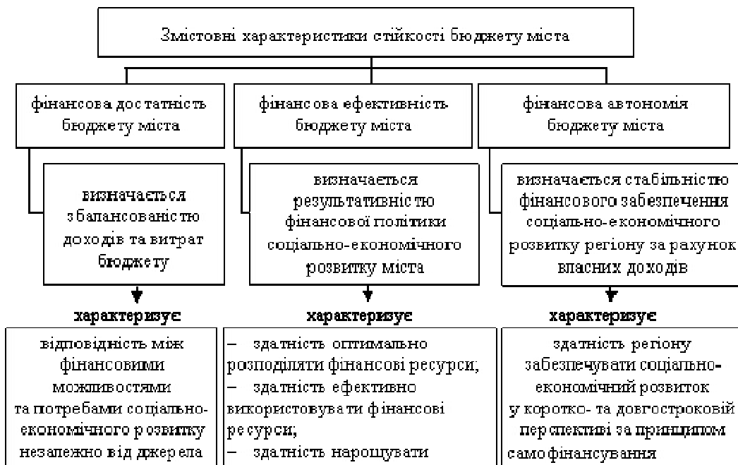
Рис. 2. Характеристики стійкості бюджету міста (розроблено автором)

Ураховуючи виділені змістові характеристики, стійкістю бюджету міста є його здатність протистояти дестабілізуючим факторам соціально-економічного розвитку на основі забезпечення достатнього обсягу фінансових ресурсів, їх оптимального розподілу та ефективного використання за умови дотримання такої структури джерел фінансування, яка забезпечуватиме стабільний розвиток міста у коротко- та довгостроковій перспективі. Або як здатність бюджету виконувати соціально-економічні завдання і одночасно створювати умови для розвитку, стимулювати поживлення економічної діяльності, сприяти підвищенню суспільних благ, удосконаленню інфраструктури, базуючись на можливості виконання бюджету за доходами та видатками за принципами достатності, ефективності, фінансової незалежності.