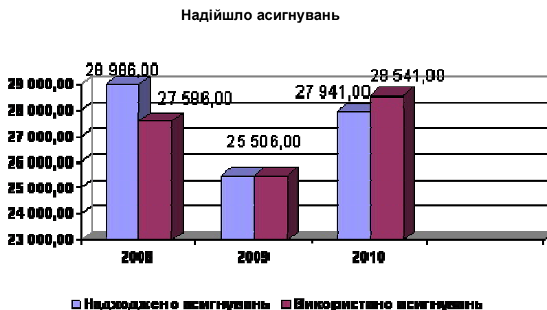
Рис. 2. Надходження і використання бюджетних асигнувань, тис. грн

Таким чином, у 2009 р. надходження та використання бюджетних асигнувань було виконано стовідсотково, у 2008 р. – на 95,17 %, тобто невикористано 4,83 %, у 2010 р. використані бюджетні асигнування становили 102,15 %, тобто перевищення використаних асигнувань із надходженнями на 2,15 %.