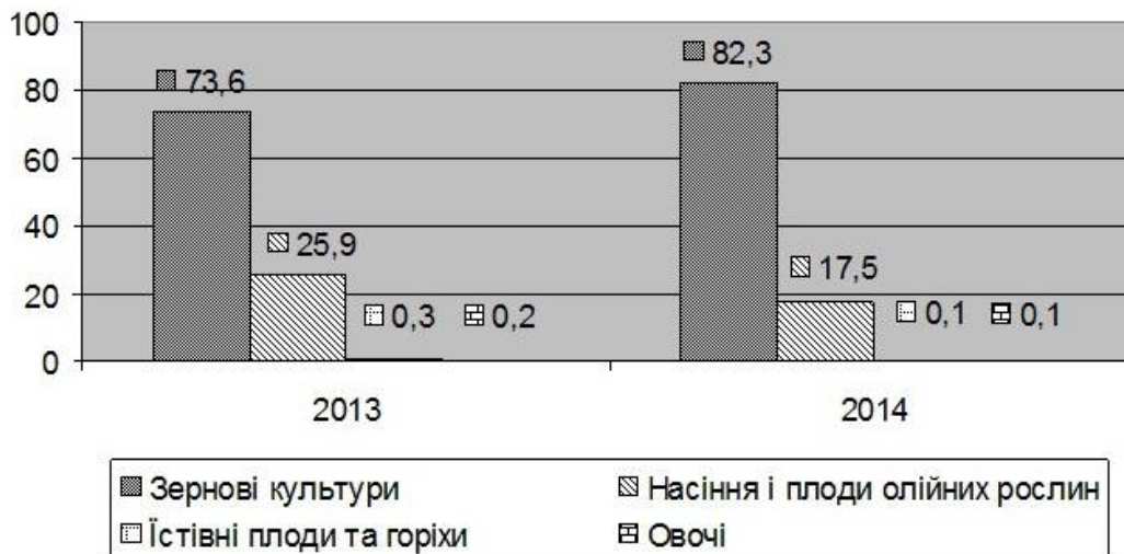
Рис. 1. Структура експорту продукції рослинництва підприємствами Миколаївської області

(у 2013р. – 99,9%). При цьому її обсяг скоротився на 14% і склав 925,1 млн дол. США. Структура експорту продукції рослинництва підприємствами Миколаївської області зосереджена на рисунку 1.