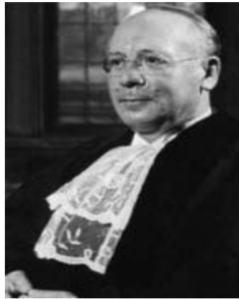
Професор Г. Лаутерпахт

народного права – професора Кембріджського університету (Велика Британія) Герша Лаутерпахта «Міжнародний білля прав людини» [1] 1 . (Він тоді жив і працював у Лондоні, хоча народився на Львівщині у містечку Жовква, а його студентські студії розпочиналися в 1915–1917 рр. на юридичному факультеті Львівського університету) [3, с. 752]. І вже у Передмові до цієї праці її автор висловив далекоглядне сподівання на те, що «... ідея Міжнародного білля прав людини є більше ніж життєво необхідною частиною структури світу» [1, с. 3].