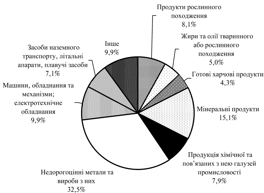
Рис. 2. Товарна структура експорту України у 2012 р., %

Вагомою складовою у структурі товарного експорту є мінеральні продукти, механічне обладнання та продукти рослинного походження. Недостатню кількість у структурі експорту займають: текстильні матеріали та вироби, деревина та вироби з деревини, полімерні матеріали, промислові товари, взуття і головні убори, продукти