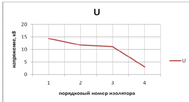
Рис. 3 – Зависимость напряжения U от порядкового номера изолятора в гирлянде

График зависимости напряжения U от порядкового номера изолятора в гирлянде показан на рис.3.