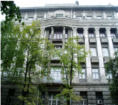
Рис. 1. Колишнє приміщення Центральної наукової сільськогосподарської бібліотеки (м. Харків, вул. К. Лібкнехта, 82)

Упродовж наступного десятиріччя (1921–1931 рр.) Бібліотека продовжувала залишатися в системі НКЗС УСРР. За цей період її фонди поповнились галузевою літературою, що надійшла з Сільськогосподарського наукового комітету України, науково-дослідних інститутів: економіки та організації сільського господарства, ґрунтознавства.