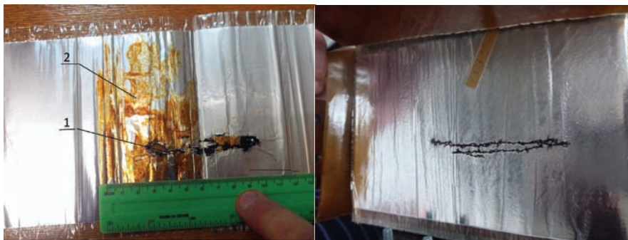
Рисунок 1 – Следы пробоев внутри секций (слева сквозной – поз. 1, справа – ниточный, следы побежалости – поз. 2)

Также при размотке внутри секций наблюдались участки со следами коричневого налета (следов побежалости) на поверхности слоев пленки. Причем места ниточного пробоя располагались как в местах следов налета, так и в зонах без видимых загрязнений слоев пленки. Нижняя группа секций в разобранных конденсаторах не была повреждена. Наибольшее количество поврежденных секций находились на второй сверху группе секций, что наблюдалось и при термографическом исследовании в процессе эксплуатации (рис. 3) на двух последовательно включенных конденсаторах связи.