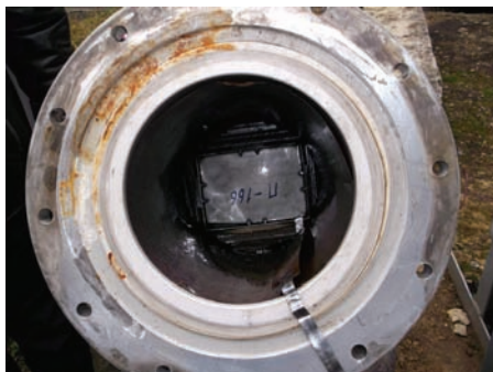
Рисунок 6 – Налет ржавчины в месте расположения верхней резиновой прокладки

Выводы. 1. У 40% СК 2008 г. выпуска (12 штук СК) типа СМ-166/3-14 УХЛ обнаружены неудовлетворительные изоляционные характеристики при