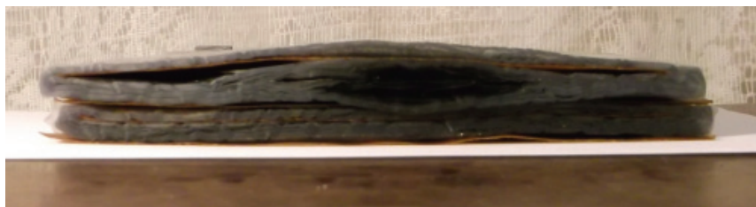
Рисунок 2 – Торцы 2-х секций с зоной почернения в средней части на участке контакта с гетинаксовой планкой

Также при размотке внутри секций наблюдались участки со следами коричневого налета (следов побежалости) на поверхности слоев пленки. Причем места ниточного пробоя располагались как в местах следов налета, так и в зонах без видимых загрязнений слоев пленки. Нижняя группа секций в разобранных конденсаторах не была повреждена. Наибольшее количество поврежденных секций находились на второй сверху группе секций, что наблюдалось и при термографическом исследовании в процессе эксплуатации (рис. 3) на двух последовательно включенных конденсаторах связи.