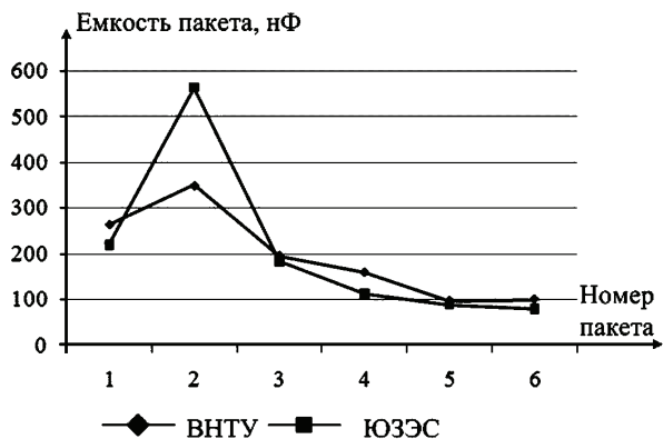
Рисунок 4 – Зависимость емкости пакета от номера пакета

Одной из возможных причин пробоя является применение некачественных гетинаксовых планок, стягивающих пакет из шести последовательно соединенных пакетов секций. На это указывает область почернения на торцевой поверхности секции в месте контакта с гетинаксовой планкой. Так федеральная сетевая компания единой энергетической системы России отмечает, что по результатам внеочередных испытаний забракованы КС на двух ВЛ 500