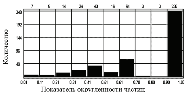
Рисунок 3 – Распределение частиц угля после обработки по фактору формы

В процессе электроразрядного измельчения бурого угля одновременно происходят деструктивные реакции разложения воды. Молекулы воды под влиянием высоких температур и давлений диссоциируют,