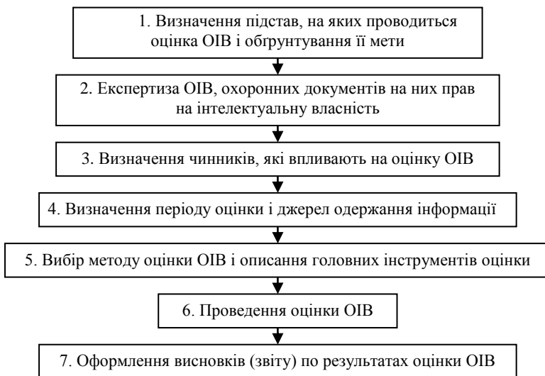
Рис. 1 - Алгоритм оцінки ОІВ у фармацевтичній галузі

Результати дослідження. Для оцінки ОІВ на ФП запропонований алгоритм, основні етапи якого приведені на рис. 1.