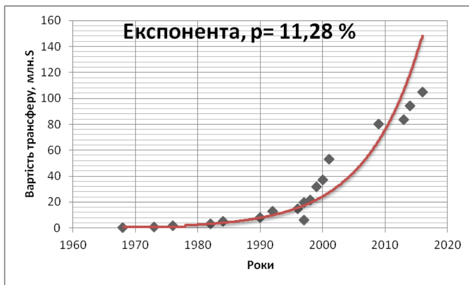
Графік 1. Excel – експонента зростання вартості футбольних трансферів

Вигляд апроксимуючої кривої, побудований Excel, наведений на тому ж графіку 1. Характер кривої ілюструє, що вона несуттєво відрізняється від реальних даних, хоча, мабуть, цей висновок був би більш надійним після проведення відповідних розрахунків.