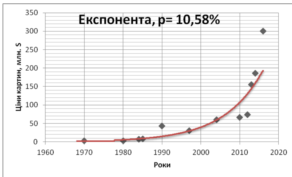
Графік 2. Excel – експонента зростання цін на картини

Цікавий наслідок зі щойно викладеного матеріалу. Якщо припустити, що надалі економічні умови будуть не гірше попередніх 60-ти років, а швидкості зростання вартості p відповідатимуть значенням, наведеним на графіках 1 та 2, наш розрахунок підказує, що ціни за одну картину в один мільярд доларів США вперше можна очікувати в 2030-і роки, а вартості трансферу футболіста в один мільярд доларів США вперше можна очікувати в 2040-і роки.