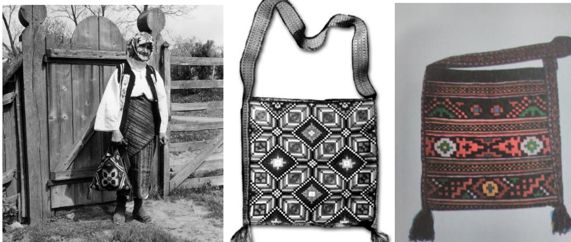
Рис. 1. Жіночий стрій і тканя торба-тайстра (с. Рідківці, Новоселицький район, Чернівецька область, Буковина)

розтягування та сушки полотно ставало більш м'якішим. З такої тканини виробляли національні костюми, які ткали різними візерунками. Доречно підкреслив М. Селівачов, що слово «орнамент» («орламент») стосується, як правило, геометричних візерунків ткацтва, вишивки, різьби. Квіткові зображення, близькі до природи, називають просто «цвіти». Не йменують орнаментом і візерунок, утворений переплетенням ниток основи й поробку: то вже буде «узор» [8]. Орнаментальні мотиви українських вишивок сягають своїм корінням у місцеву флору та фауну, в історичну традицію. У давнину основні орнаментальні мотиви відображали елементи символіки різних стародавніх культів. Художні вишиванки [11, 39]. Яскравою візуалізацією описаного вище є світлина жіночого строю та тканої торби із села Рідківці, що на Буковині (рис. 1).