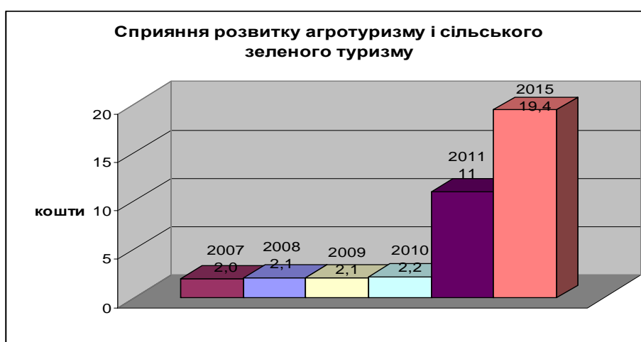
Рис. 2. Фінансування виконання заходів, передбачених «Загальнодержавною програмою соціально-економічного розвитку українського села на період до 2015 р.», млн грн

Згідно з додатком до цієї програми на фінансування заходів, пов'язаних з розвитком агротуризму й сільського зеленого туризму, упродовж 2007-2015 рр. передбачається залучити 19,4 млн грн, з яких частка державного бюджету має становити 23,2%, місцевих бюджетів – 10,3% (рис. 2).