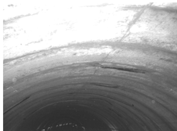
Рис. 2. Вид участка дефектной поверхности

Во время проведения обследования тоннеля на поверхности обделки в отдельных местах были обнаружены отслоения бетона. В процессе эксплуатации на исследуемом участке в обделке стали возникать трещины и открытые отслоения бетона (рис. 2).