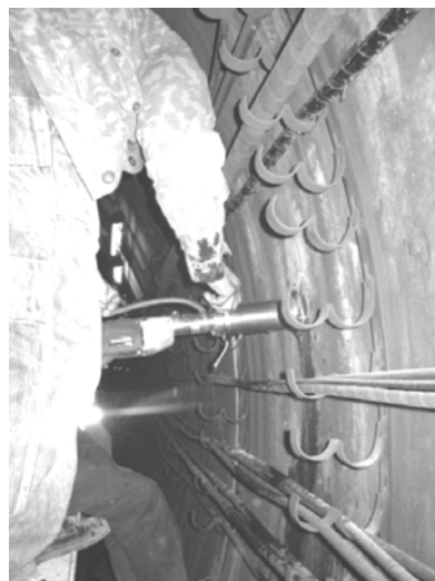
Рис. 4. Отбор образцов бетона путем выбуривания кернов

Радиолокационные измерения выполнялись с использованием георадара «ЗОНД-10» на частоте 150 МГц, с варьированием поляризационных параметров зондирующего сигнала. Совместная обработка временных зависимостей амплитуд отраженных сигналов с различной поляризацией позволила построить радиолокационные изображения зондируемых подповерхностных сред по относительной плотности и относительной влажности.