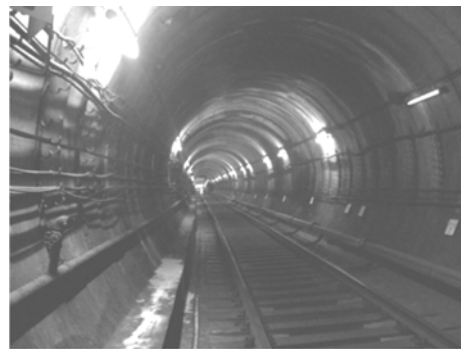
Рис. 1. Общий вид участка перегонного тоннеля

[4, 5]. Обследованный участок Минского метро был сооружен в 1980 г. Обделка тоннеля выполнялась из бетона марки М300 с использованием проходческого щитового комплекса ТЩБ-7. Участок перегонного тоннеля был сдан в эксплуатацию в 1984 г. (рис. 1).