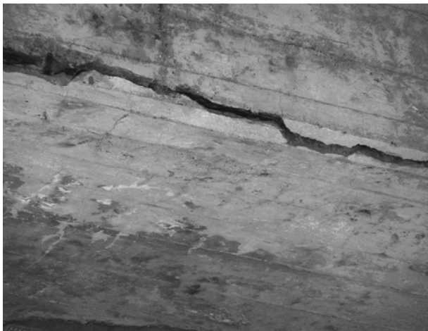
Тріщина розкриттям більше 10 мм (від удару)

Довговічність бетону залежить від двох основних показників, які можна проконтролювати, а саме – карбонізації та непроникності. Карбонізація передбачає зміни з часом хімічної структури бетону, яка приводить до активізації процесу корозії арматури, бо сам процес карбонізації зменшує показник рН лужності бетону, а, як відомо, саме лужний характер бетонного середовища впливає на захист сталевих арматур від процесів корозії.