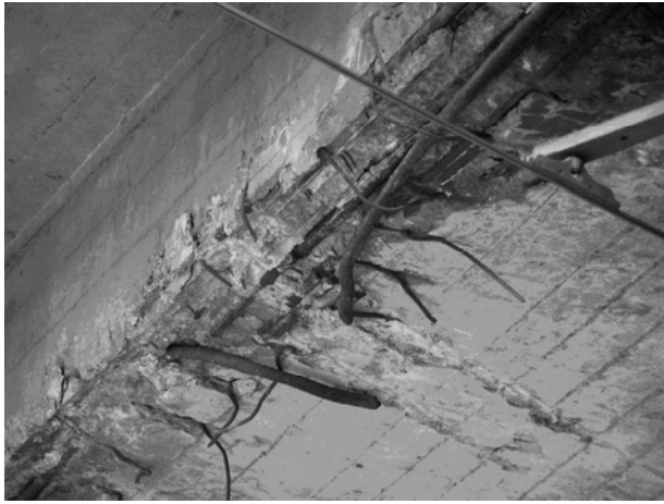
Розрив арматури від удару вантажем