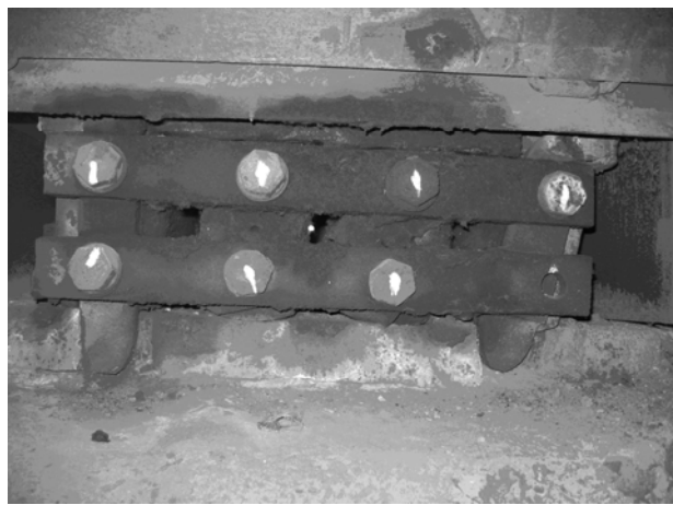
Нахил котків, зрізані бовти, деформована планка