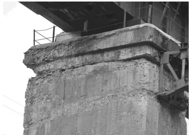
Відшарування частини опори