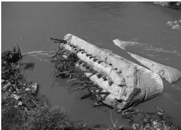
Зруйнована повинню руслова опора