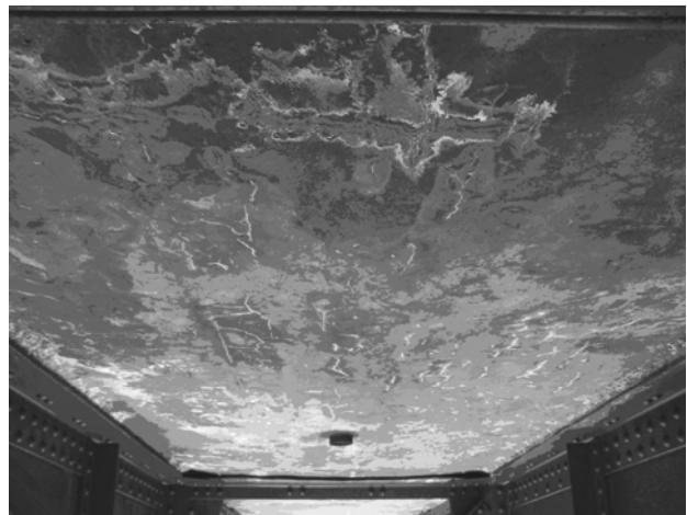
Порушення гідроізоляції (вилугування)