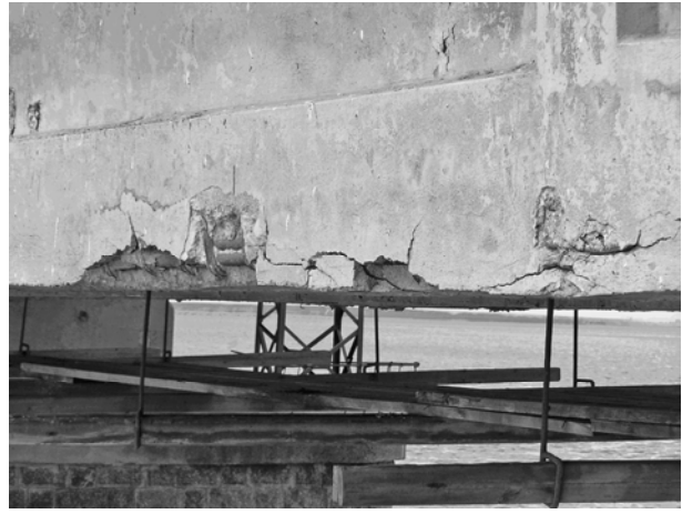
Руйнація прогонової будови негабаритним вантажем