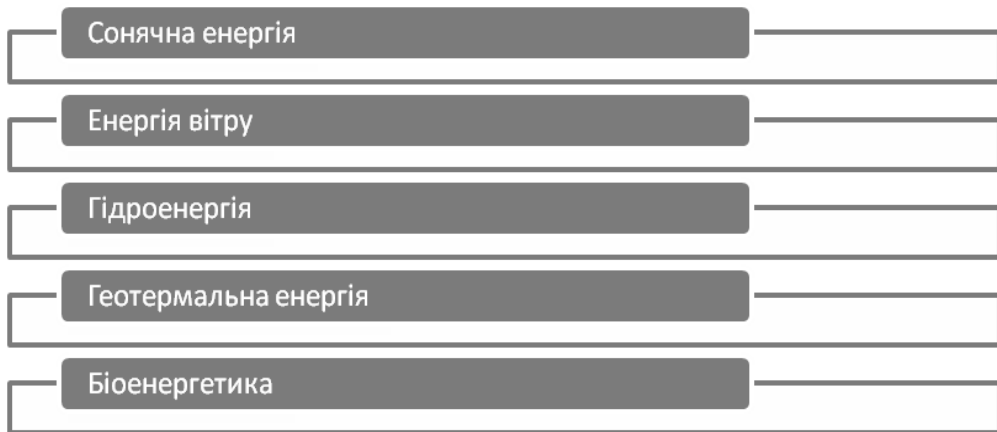
Рис. 2. Основні види відновлюваних джерел енергії *

з біомаси. Виробництво рідких видів палива з біомаси – один з ефективних способів її утилізації, що вкрай важливо для країн, залежних від імпорту первинних енергоносіїв. Це повною мірою стосується і України, забезпеченість якої власними енергоресурсами становить лише 20-25 %, а стан довкілля потребує негайного покращення.