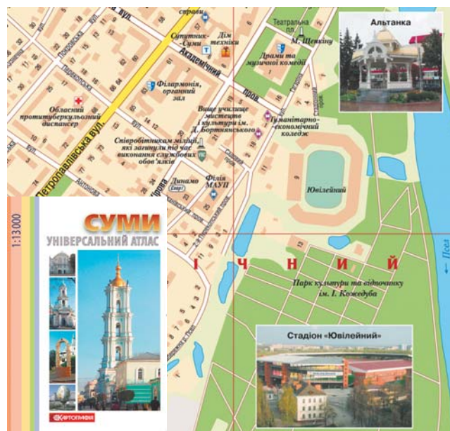
Мал. 2. Універсальний атлас міста Суми (обкладинка та фрагмент карти)

Кожен атлас має якісь відмінності у змістовому наповненні, що пов'язано з унікальністю та неповторністю об'єктів картографування.