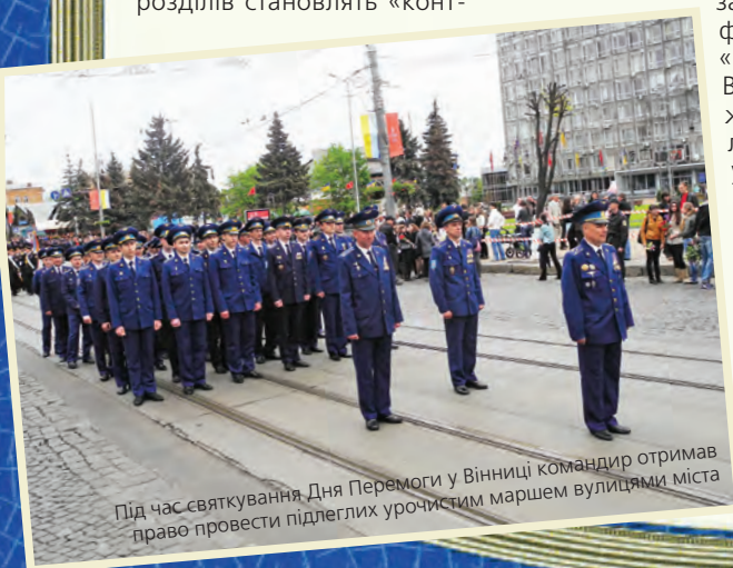
Під час святкування Дня Перемоги у Вінниці командир отримав право провести підлеглих урочистим маршем вулицями міста