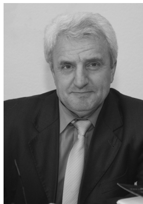
Олександр ЛИСЕНКО, завідувач відділу історії України періоду Другої світової війни Інституту історії України НАН України, доктор історичних наук, професор