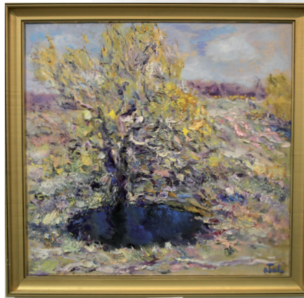
О. Басанець. «Озерце»

Думаю, такі картини художників люди мусять знати, такі твори мистецтва мають друкувати в підручниках. Це є правдива історія, яку ніколи ніхто не переписує, не змінить.