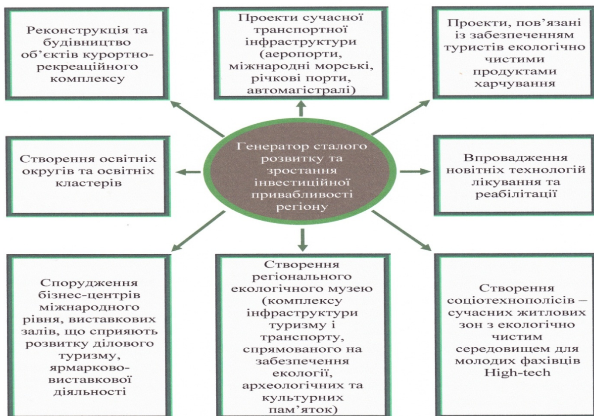
Рис. 1. Флагманський проект транспортно-туристичний кластер «Південні ворота України»