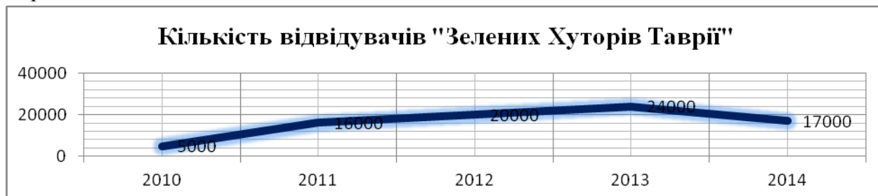
Рис. 3. Кількість відвідувачів історико-розважального комплексу «Зелені Хутори Таврії»

Не дивлячись на те, що екскурсійний супровід залишається невід'ємною складовою програми історико-розважального комплексу, почали додаватися нові форми відпочинку та ознайомлення із атракторами, такі як квест тощо, а також заклад перейшов від сезонного графіку роботи до цілорічного. У літній період, коли не працюють школи, майстри демонстрували свої ремесла на морських узбережжях Херсонщини.