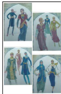
Рис. 4 Разработка ассортиментных рядов моделей на основе национальных и этнохудожественных традиций Ирана