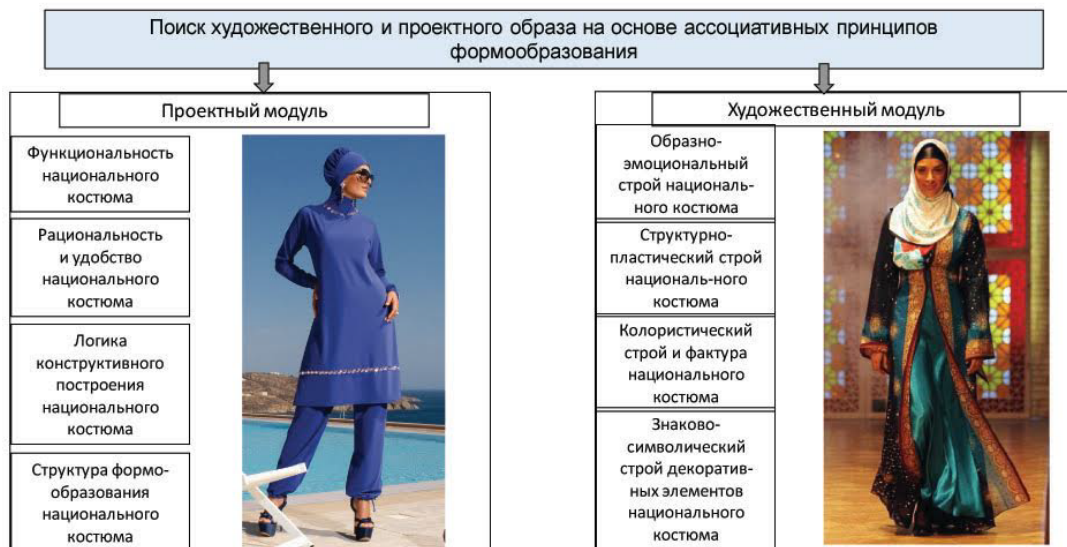
Рис. 1 Разработка модели художественного проектирования современной одежды на основе ассоциативных принципов формообразования

Результаты исследований. Для усовершенствования процесса художественного проектирования современной женской одежды, была разработана модель, которая включала в себя структуризацию процесса поиска художественного и проектного образа, на основе ассоциативных принципов формообразования. Проектный модуль предназначен для определения функциональности, рациональности и удобства пользования, логики конструктивного построения, а также структуры формообразования национального костюма. Художественный модуль определяет образно-эмоциональный, структурно-пластический, колористический строй национального костюма, его фактуру и знаково-символические элементы (рис.1).