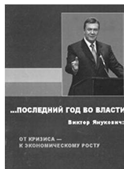
І прапор перевернутий, і назва не та

Інколи, правда, постріли з книжкової пропагандистської зброї регіоналів влучали у "молоко". Так, до позачергових парламентських виборів 2007 року регіонали видали брошуру Віктора Януковича "...І рік при владі". Презентували її 4 серпня, у день, коли роком раніше лідера ПР вдруге призначили прем'єр-міністром України. Представлене видання спричинило конфуз. Як догледіли критики, зображення державного прапора на обкладинці книги видавці подали перевернутим: зверху — жовтий, знизу — синій кольори, а потрібно навпаки. Наклад видання довелося передрукувати.