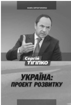
Обкладинка книжки Сергія Тігіпка "Україна"

Системний підхід у застосуванні книжкових технологій для пропагування ідей політичної сили продемонструвала Українська консервативна партія під час ведення парламентської виборчої кампанії 2006 року. В УКП пішли шляхом видання "брошур-метеликів" — невеликого обсягу з різних аспектів діяльності консерваторів. Упродовж короткого проміжку часу побачили світ "Сучасний політичний стан та вибір 2006 року", "З вірою у перемогу українства", "Бог і Україна — понад усе!", "Український консерватизм як сутність національної ідеї", "Захист нації і держави: доленосні проблеми", "Парламентські вибори та їх наслідки". Ці видання розповсюджувались через книготоргівлю, використовувались в агітаційній роботі осередків УКП.