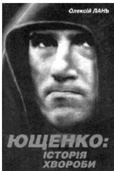
Обкладинка книжки Олексія Ланя "Ющенко. Історія хвороби"

Поновилися такі розмови, до речі, і 2008 року, коли у Москві спочатку в електронному, а потім у паперовому форматі видали біографічну книжку ізраїльського автора Юрія Вільнера про батька тогочасного Президента України "Андрій Ющенко. Персонаж і легенда" [1]. У виданні, побудованому на припущеннях, автор фактично стверджував, що батько Віктора Ющенка у період Другої світової війни співпрацював з німцями спершу як табірний поліцай, а потім як табірний інформатор. Не приховував автор і того, що його інтерес до теми був обумовлений поглядами самого Віктора Ющенка на історію війни, зокрема на участь в ній ОУН-УПА. Своє дослідження теми провели і журналісти "Дойче Велле". Вони з'ясували, що "відомого історика і журналіста" Юрія Вільнера... не існує, він — фантом, а сліди від публікації привели до тижневика "2000", який запідозрили у зв'язках з російськими спецслужбами. У самому тижневику свою причетність до книги Вільнера заперечили. Утім, невдовзі видали власну — "Загадки родини Ющенка", куди увійшли матеріали, що друкувались у "2000" впродовж 2006—2008 років, у тому числі — історія батька українського Президента.