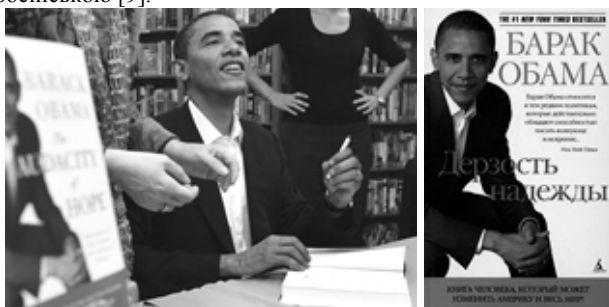
Барак Обама презентує

У багатьох країнах уже склались і традиції книжкового передвиборчого PR. Приміром, у США свої книжкові видання до останніх президентських виборів 2008 року підготували більшість претендентів на пост глави держави. Так, з'явилися друком книги Гілларі Клінтон, Елла Гора, Джона Керрі, Джона Маккейна. Найгучніший успіх мала публіцистична "Сміливість надії" Барака Обами, яка побачила світ 2006 року. Варто сказати, що на ту пору Обама вже був загально визнаним літератором. Власне і сходження на політичний олімп він розпочав у тому числі завдяки й літературі. 1995 року Обама видав "Мрії від мого батька", яка ушлявила його як автора. Наступного року книжку удостоїли почесної літературної премії "Греммі", Обама став сенатором, а "Сміливість надії" — бестселером. З притаманним йому літературним хистом Обама дохідливо ознайомив читачів не тільки зі своєю політичною програмою, а й запропонував спільно порозмірковувати про американські та світові проблеми. Книга стала популярною не лише в Америці, а й була перекладена на більшість європейських мов. 2010 року вийшла і російською [9].