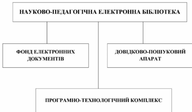
Рис. 1. Структура НПЕБ

режимі, а також через веб-портал бібліотеки. НПЕБ складається з фонду електронних документів (ФЕД), довідково-пошукового апарату (ДПА) й програмно-технологічного комплексу (ПТК) (рис. 1).