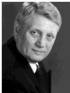
Микола Сенченко, директор Книжкової палати України, професор