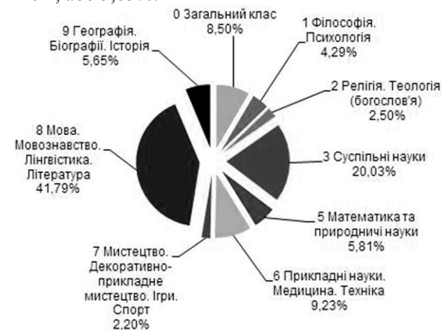
Діагр. 1. Розподіл книг і брошур за класами УДК

Результати бібліометричного аналізу бібліографічної інформації про книги та брошури в межах класів УДК наведено в табл. 1—10 (кількісний і відсотковий розподіл відповідно до загальної кількості записів у класі).