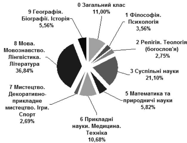
Діагр. 1. Розподіл книг і брошур за класами УДК

9 Географія. Біографії. Історія — 756 записів, або 5,56%.