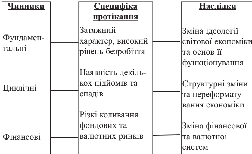
Рис. 2. Механізм протікання світової економічної кризи

Аналізуючи причини кризи, можна спробувати проаналізувати специфіку протікання та основні наслідки (рис. 2).