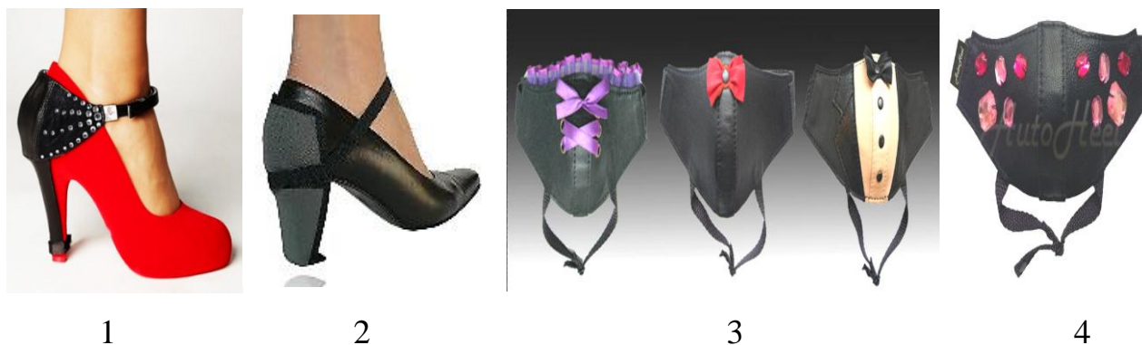
Рис. 5. “Автоп'ятка” - пристосування для захисту п'яткової частини і каблука взуття жінок-водіїв