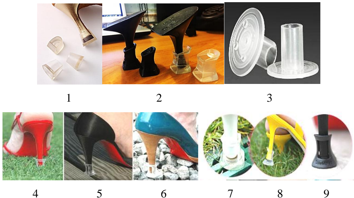
Рис. 3. Різновиди (за формою, кольором, конструкцією) насадок (чохлів) для захисту ходової поверхні каблука (вгорі) та види поверхонь (внизу), для яких вони призначені

4) за кольором вони бувають безколірні прозорі (рис. 3.1-3.8), забарвлені у масі (рис. 3.2, 3.9) та багатоколірні (рис. 4);