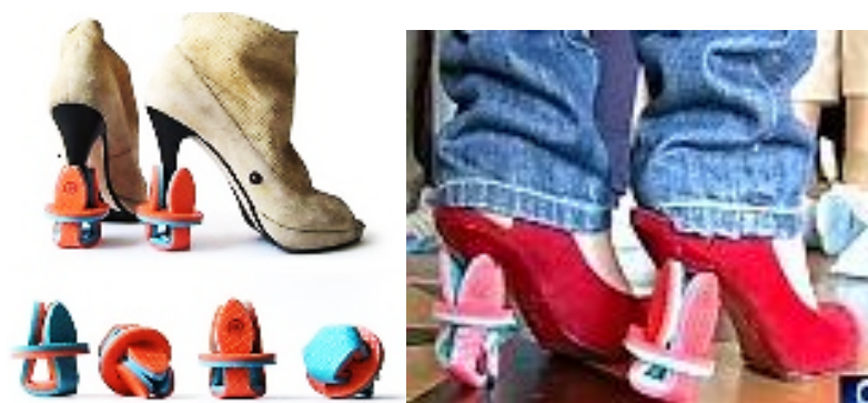
Рис. 4. Насадки (чохла) для захисту підлоги від пошкодження каблук-“шпилькою”

За конструкцією більш оптимальною вважається автоп'ятка, яка захищає і п'яткову частину взуття (приблизно на довжину крил жорсткого задника), і весь каблук (особливо, якщо це каблук-“шпилька”). Такий виріб (рис. 5.2) складається з двох основних частин (деталей): плоскої (закриває п'яткову частину взуття) та об'ємної (закриває каблук, називається “хвостик” та кріпиться внизу каблука на застібку (“велькро”; кнопку, карабін, зав'язку); якщо каблук невисокий, то “хвостик” можна підігнути.