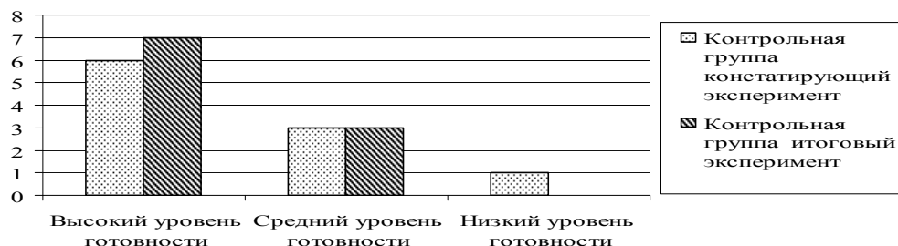
Рисунок 1.3. Сравнение результатов констатирующего и итогового эксперимента в контрольной группе

звено до проведения коррекционной программы и после ее проведения. Выявить возможные проблемы при переходе младшего школьника в среднюю школу.