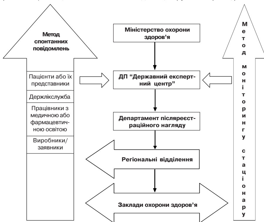
Рис. 1. Функціонально-організаційна модель системи фармаконагляду в Україні.

Сучасну функціонально-організаційну модель системи фармаконагляду представлено на рисунку 1, що складається з Департаменту післяреєстраційного нагляду лікарських засобів Державного експертного центру МОЗ України, регіональних відділень Департа-