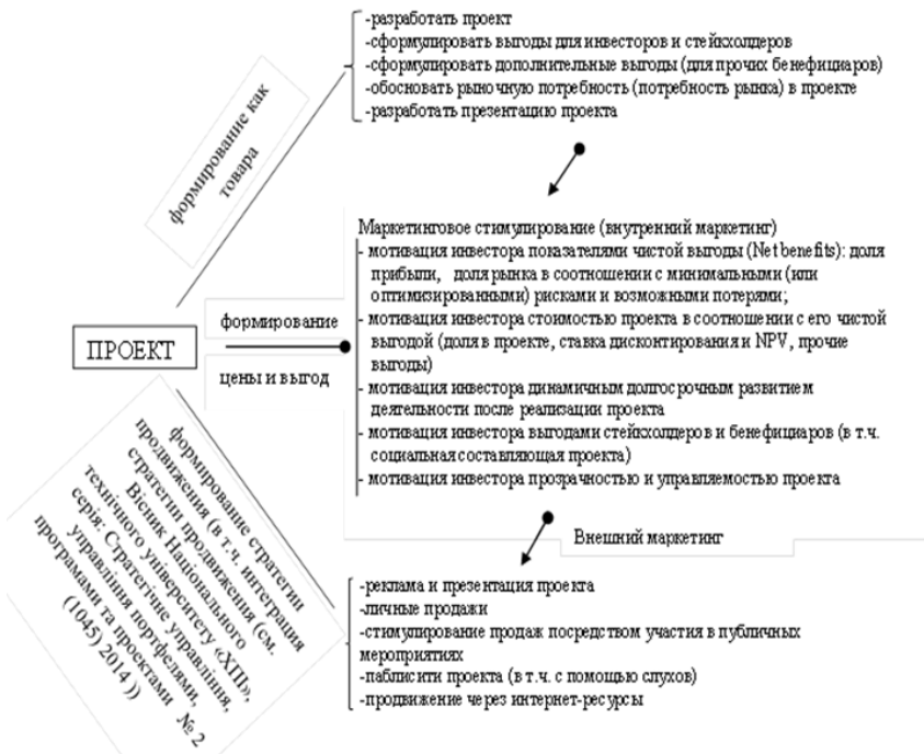
Рис. 1 – Основные функции маркетинга

На рисунке 2 представлено изображение последовательного формирования проекта как товара с последующим движением его к конечному результату (когда он продан инвестору, реализован, и информация о результатах проекта размещается в СМИ). Данная маркетинговая оболочка проекта, разбитая на этапы реализации маркетинговых стратегий, наглядно демонстрирует логику применения инструментов маркетинга в управлении проектом.