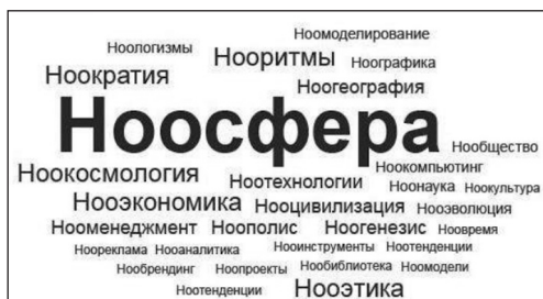
Рис. 1. Найбільш поширені ноологізми у 2011 р., відтворені у вигляді «хмари тегів»

ловання, нооком'ютинг) і виявлених ним у працях сучасних українських і зарубіжних авторів застосував своєрідну схему, наведену на рис. 1.