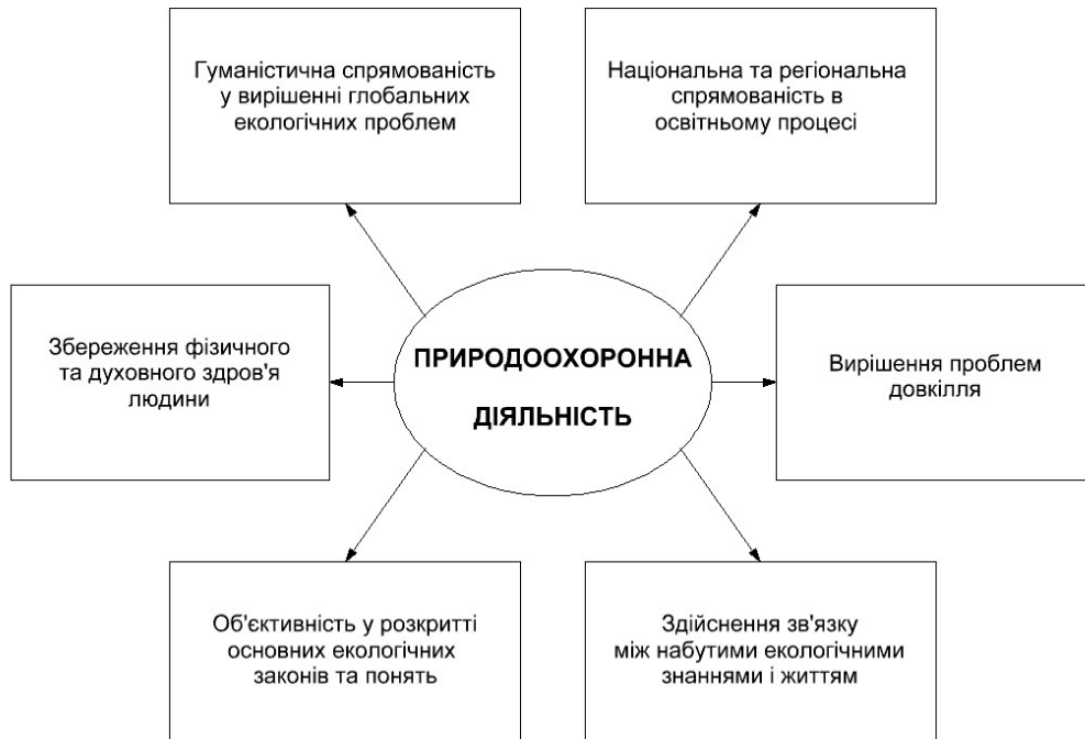
Рис. 1. Система природоохоронної діяльності (за А. Швиденко, В. Руденко, В. Євдокименко)

з гуманістичною спрямованістю та рахуванням екологічних чинників (раціональне використання природних ресурсів, забезпечення населення екологічно чистими продуктами харчування, захист середовища від забруднення промисловими та побутовими відходами); збереження фізичного та духовного здоров'я людини; об'єктивність у розкритті основних екологічних законів та понять про загальні закономірності існування природних та антропогенних систем; вирішення проблем довкілля; здійснення зв'язку між набутими екологічними знаннями і життям, розкриття їх цінності не лише у виробництві, а й у повсякденному житті людини: вдосконалення різних форм господарської, рекреаційної і культурно-побутової діяльності людини [9, с. 46].