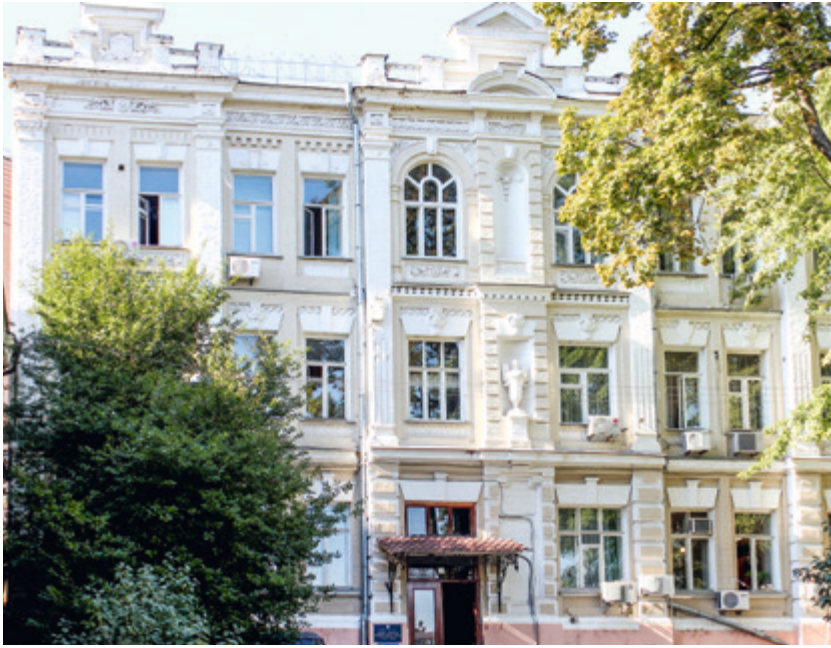
Будинок на вул. Воровського, 16 у м. Києві, де у 1944—1945 рр. знаходився Верховний Суд УРСР

[...] неухильно стежити за виконанням вироків, рішень і ухвал судових колегій Верховного Суду УРСР» 40 .