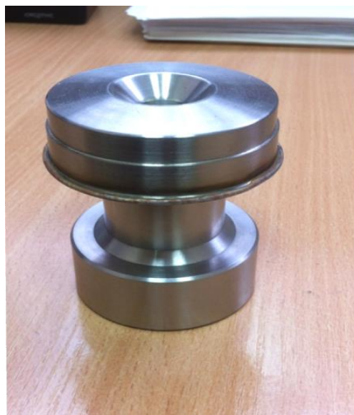
Рис. 2. Дослідний зразок мішені, що обертається.

рис. 2. Усі деталі мішені виготовлено з нержавіючої сталі. Деталі мішені зварені між собою електронно-променевим зварюванням. Вода, що охолоджує мішень, надходить через внутрішню трубку, потім омиває з усіх боків внутрішній корпус, капсули із сіллю і витікає у шток мішеневого пристрою. Герметичність з'єднання мішені на штоці забезпечується гумовими ущільненнями. Мета дослідження – забезпечити температурний режим, при якому максимальна температура шару солі \text{RbCl} у мішені не перевищує 700 °C. Заданий температурний режим здійснюється за допомогою зміни частоти обертання мішені (до 40 об/хв) та витратою охолоджувальної води до 60 л/хв, температура охолоджуваної води не повинна перевищувати 80 °C. Температура води на вході до мішені 20 °C.