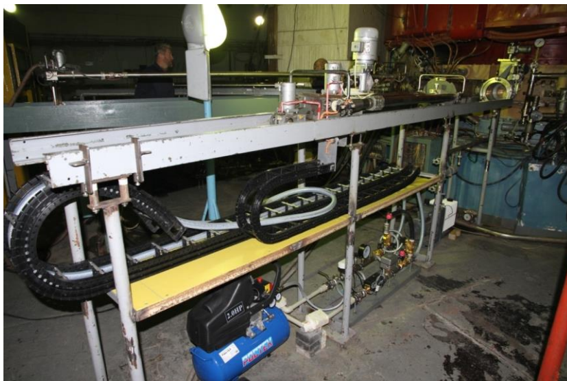
Рис. 3. Загальний вигляд опромінювальної установки.

електродвигуном. Перша система переміщує візок із початкового положення в положення, при якому мішень опиняється в шлюзі, та після опромінення повертається в початкове положення. Друга система доставляє мішень зі шлюзу до камери прискорювача на радіус опромінення та після опромінення повертає мішень до шлюзу. Третя система забезпечує обертання мішені в прискорювальній камері протягом усього процесу опромінення. Для контролю за положенням мішені, відносно центру циклотрона, на візку встановлено датчик положення – енкодер. Швидкість обертання мішені вимірюється розробленим індукційним тахометром. У випадку зупинки мішені, що обертається, під час опромінення датчик обертання повинен практично миттєво передати сигнал системі блокування для виключення пучка, щоб запобігти прогорянню мішені. На рис. 3 показано опромінювальну установку.