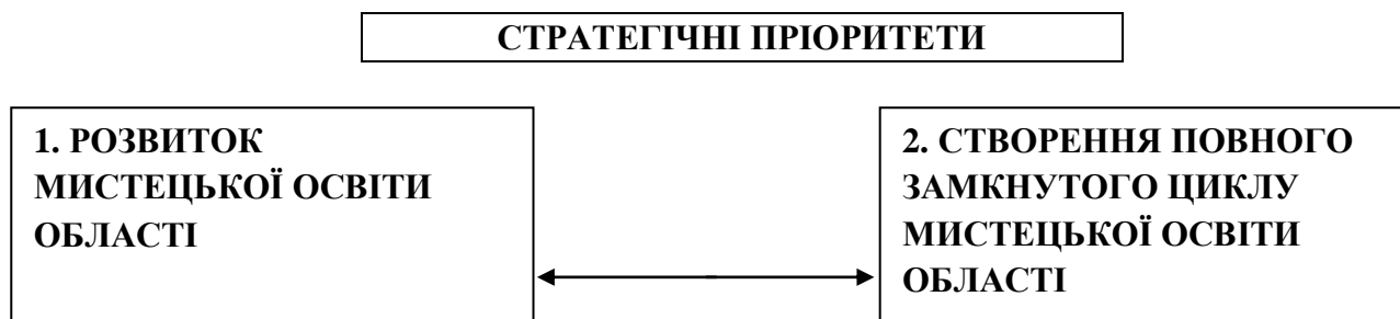
Рисунок 3 - Стратегія розвитку мистецької освіти в Донецькій області [7]

Стратегічний пріоритет «Стратегія розвитку мистецької освіти в Донецькій області» (рис. 3).