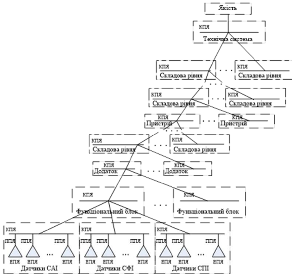
Рисунок 2 – Дерево якісного стану узагальненої сенсорної інфраструктури технічної системи