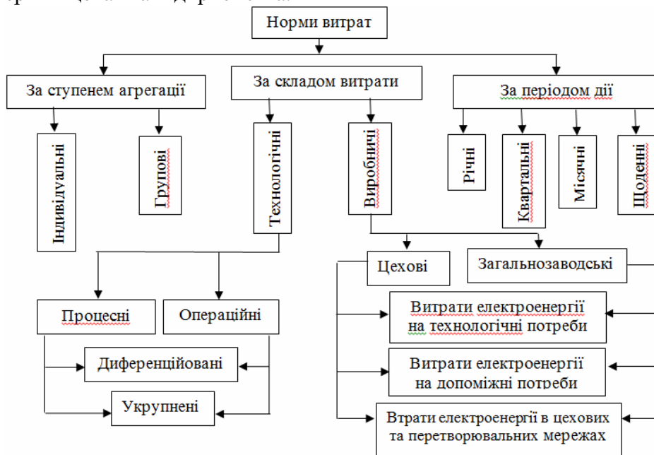
Рисунок 1 – Класифікація питомих норм витрати електроенергії

Згідно з урахуванням сучасних напрямків оцінки питомого електроспоживання в промисловості пропонується наступна класифікація норм витрат електричної енергії (рис. 1). Ця класифікація використовується для контролю за використанням електроенергії в цехах та підприємства.