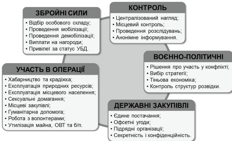
Рис. 1. Система показників корупційних загроз, що впливають на ефективність підготовки та застосування військових формувань у збройних конфліктах

корупційні ризики, пов'язані з безпосередньою участю в операціях.