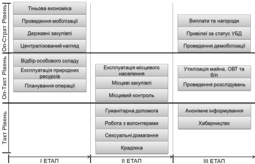
Рис. 3. Пріоритетність корупційних ризиків за напрямками їх вияву, за етапами та рівнями збройного конфлікту

Отже, кожен етап протікання збройного конфлікту має свої особливості за ступенем напруженості стосунків між її учасниками та характером застосування збройних сил. Своєю чергою це створює особливі для кожного етапу умови для появи, існування та розвитку корупційних ризиків. Відповідно до розробленої системи показників корупційних загроз у збройних конфліктах було розроблено набори показників корупційних ризиків за етапами збройного конфлікту (рис. 3).