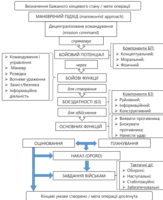
Рис. 3. Схема концептуального підходу до планування та ведення сухопутної операції за стандартами НАТО

Планування маневреного підходу ставить на перший план розуміння ситуації і маніпулювання людською природою, використання вразливих сторін противника, застосування непрямих і оригінальних способів дій та мінімізацію втрат. Цей підхід пропонує швидкі результати або результати значно більші, ніж використані для їх досягнення ресурси, тому він є привабливим для слабшої сторони у кількісному відношенні або сторони, яка хоче звести до мінімуму обсяг задіяних (витрачених) ресурсів. Сучасні бойові дії, як правило, не є симетричними, зокрема через те, що асиметрію зумовлюють відмінності у на-