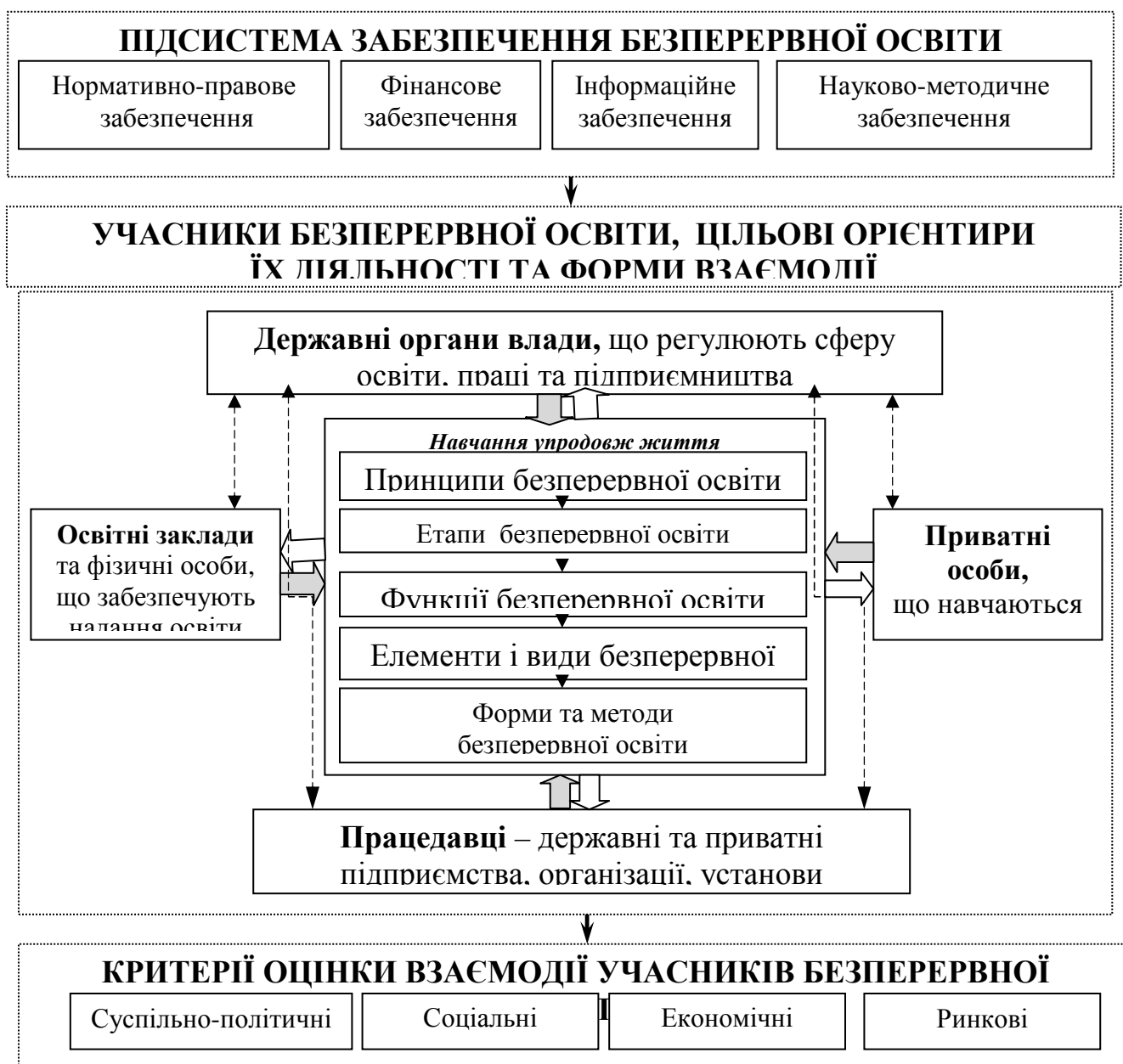
Рис. 1. Схема організації системи безперервної освіти*

За результатами проведених досліджень розроблено систему безперервної освіти та визначено взаємозв'язки між її підсистемами та елементами (рис. 1).