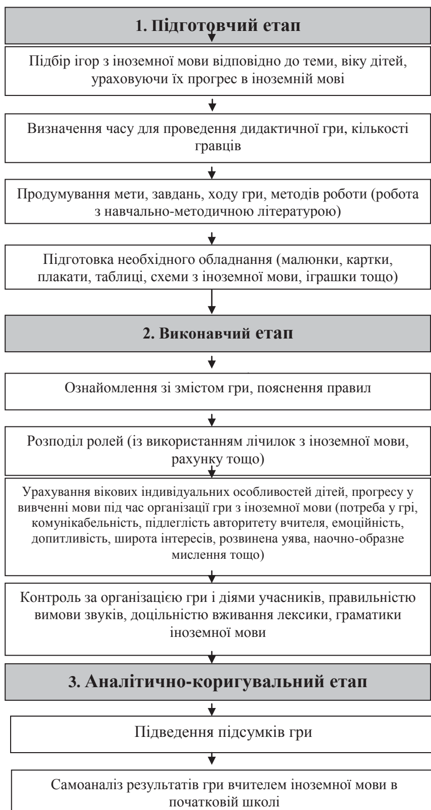
Рис. 2. Етапи організації дидактичних ігор для вивчення іноземної мови в початковій школі

продумування мети, завдань та ходу гри, послідовності виконання завдань, змін видів діяльності, місць, положень під час виконання завдань у процесі гри (В. Букатов [1, с. 44]).