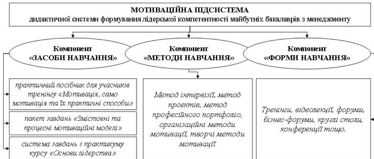
Рис. 2. Мотиваційна підсистема

ня до активної роботи і співпраці з викладачами кафедри; направлення студента на різні семінари й науково-практичні конференції; сприяння у висуванні на престижний конкурс; можливість представляти університет, кафедру, факультет на значимих заходах (форумах, конференціях), у т. ч. міжнародних; допомога в узагальненні досвіду науково-педагогічної діяльності кафедри, факультету, залучення до співавторства у наукових публікаціях із науковим керівником, іншими викладачами кафедри, у підготовці авторських підручників і посібників, навчально-методичних матеріалів, дистанційних курсів тощо [11].