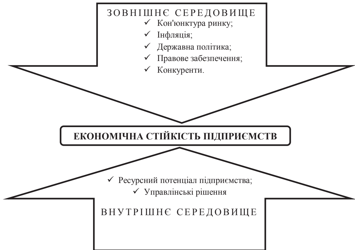
Рис. 1. Чинники внутрішнього і зовнішнього середовища